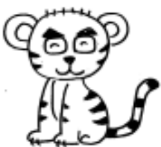
院長は年男（五黄の寅）

天気予報をこまめにチェックしましょう。自分や我が子がどんな時に症状が強くなるかを、カレンダーやスマホアプリなどに記録しておくこと事前の対処がしやすくなります。ストレッチや睡眠不足などの生活習慣も自律神経の乱れを起こすので生活の改善も大切です。痛み止めなどの準備をしておき、早めに薬を飲むことや、貯まった水分を取り除く漢方薬（五苓散や苓桂朮甘湯など）なども効果があるとされています。